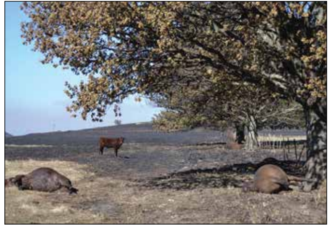
Verwoestende verliese van mense-lewe, wonings en geboue asook lewende hawe was ervaar op 'n groot skaal.

Die werksaamhede van Kwanalu se securiteitslessenaar oefen steeds 'n direkte invloed uit op landelike veiligheids-