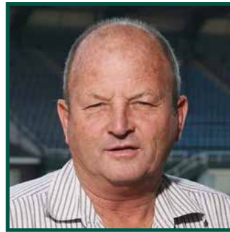
Verslag van die President deur Michael Black

D it is 'n eer en 'n voorreg om die president se jaarverslag vir die afgelope 12 maande voor te lê.